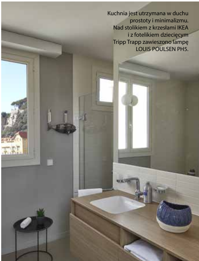
Kuchnia jest utrzymana w duchu prostoty i minimalizmu. Nad stolikiem z krzesłami IKEA i z fotelikiem dziecięcym Tripp Trapp zawieszono lampę LOUIS POULSEN PH5.