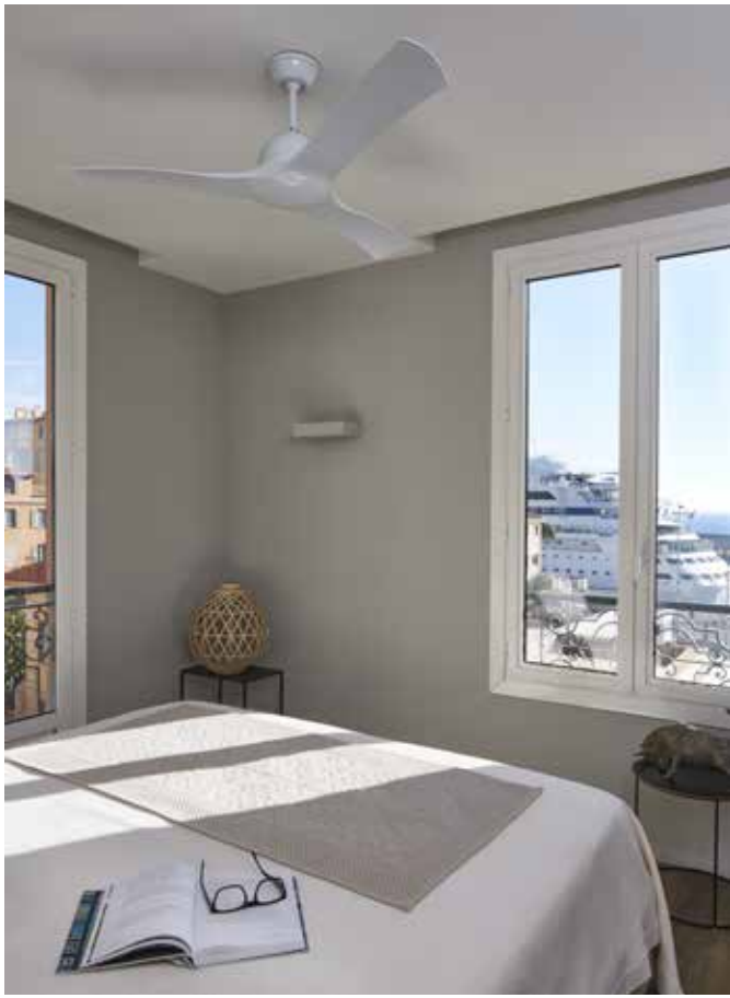
Kuchnia jest utrzymana w duchu prostoty i minimalizmu. Nad stolikiem z krzesłami IKEA i z fotelikiem dziecięcym Tripp Trapp zawieszono lampę LOUIS POULSEN PH5.